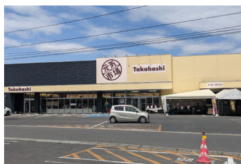
元気市場たかし上町店 まで342m