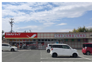
ツルハドラッグ上町店ま で249m