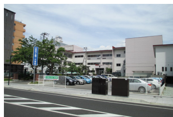
山形市立第二小学校まで 1700m