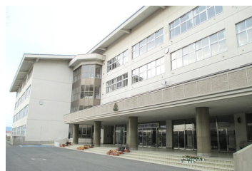
山形市立第三中学校まで 1342m