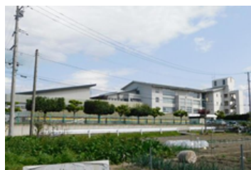
山形市立第二中学校まで 1,500m