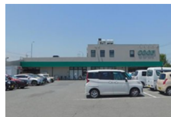
コープしろにしまで 450m