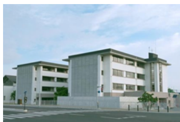
山形市立第七小学校まで 850m