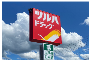
ツルハドラッグ東根神町 西店まで2355m