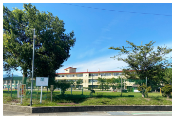
東根市立大富小学校まで 1180m