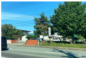
東根市立大富中学校まで 624m