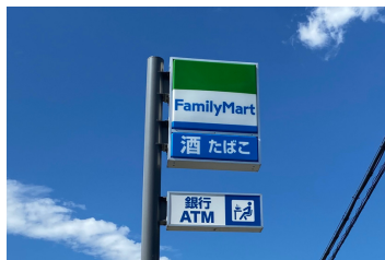
ファミリーマート山形空 港前店まで384m