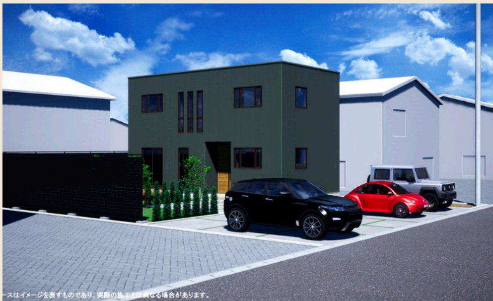
※イメージを表すものであり、実際の施工とは異なる場合があります。

自然豊かな 米沢での 暮らしを はじめませ んか？ QOLの高い 生活を ご提案 します！